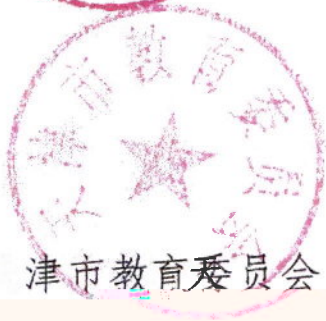
天津市教育委员会