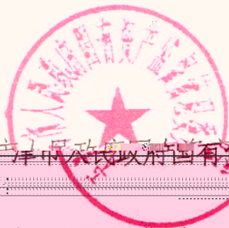
天津市人民政府国有资产监督管理委员会