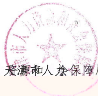
天津市人力资源和社会保障局